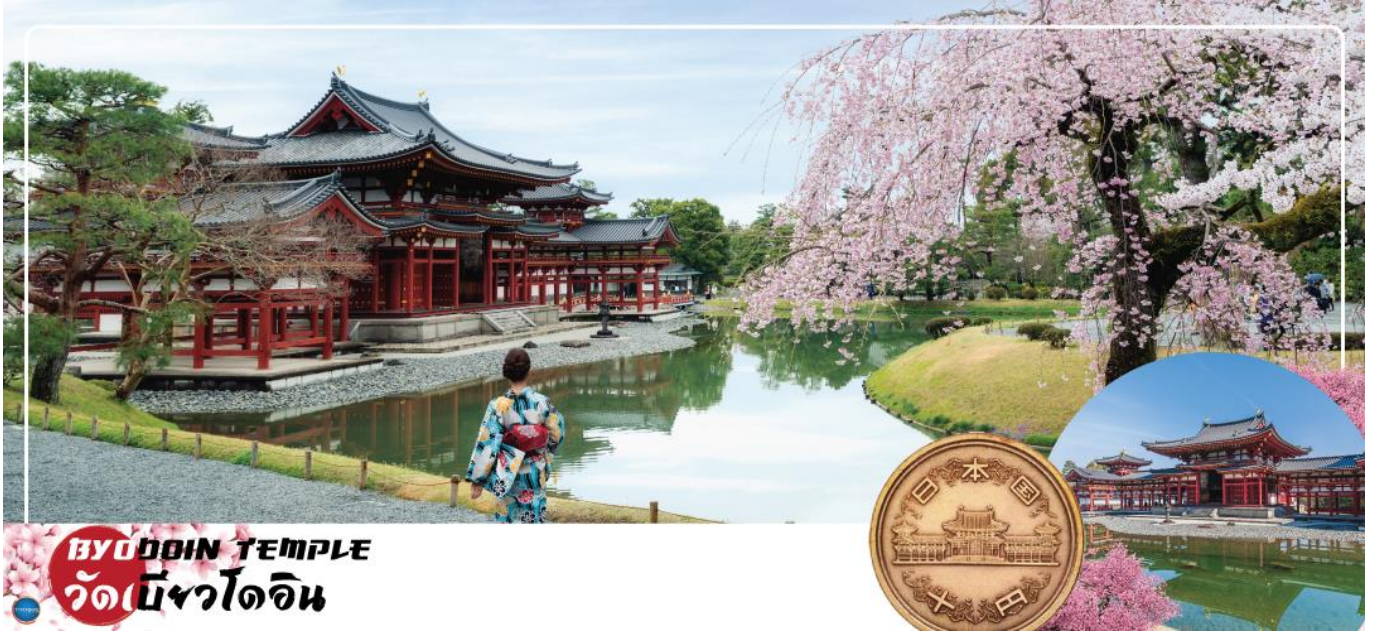
BYODOIN TEMPLE วัดเบียวโดอิน

นำท่านเดินทางสู่ เมืองอุจิ (Uji) เมืองเล็กๆ ทางตอนใต้ของเกียวโตหนึ่งในแหล่งปลูก "ชาเขียวอุจิ" ที่ดีที่สุดในญี่ปุ่น ซึ่งมีแม่น้ำอุจิสายสำคัญ และเป็นต้นกำเนิดของวัฒนธรรมเก่าแก่ต่างๆ