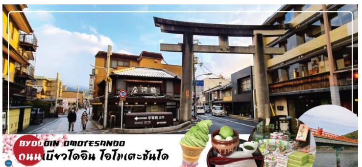
BYODOIN OMOTESANDO ถนนเบียวโดอิน โอโมเตะซันโด

รสชาเขียวทั้งหมด เมื่อท่านเดินทางสุดถนนแล้ว จะเจอ สะพานอุจิ (Uji Bridge) หนึ่งในสามสะพานเก่าแก่ที่สุดในญี่ปุ่น สร้างขึ้นในปี ค.ศ. 646 อายุคร่าวๆ ประมาณ 1,370 ปี เกือบพังทลายมาแล้วหลายครั้งจากสงคราม น้ำท่วม และแผ่นดินไหว แต่ทุกครั้งชาวเมืองก็ร่วมพลังกันซ่อมแซมจนกลับมาใช้งานได้อีกครั้ง และยึดหยัดมาจนถึงวันนี้ กลายเป็นมรดกทางประวัติศาสตร์ของชาวเมืองอุจิ